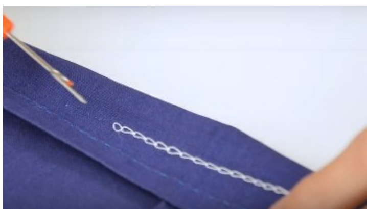
Poslední očko povytáhněte ven