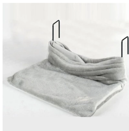
Obrázek č. 2 - Fotografie pelíšku těsně před zavěšením